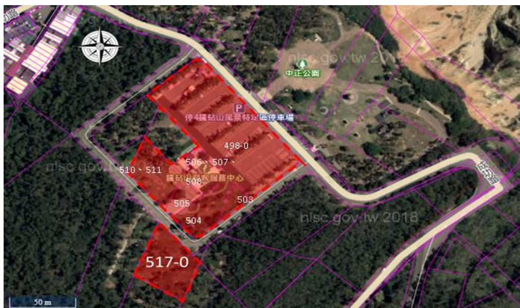
圖3.1-1 本案用地範圍圖

基地內擬委託民間機構營運範圍包括大甲區劍井段498、503至508及510、511、517等地號，10筆土地面積合計12,266.27平方公尺其中包含停車場（現有大型車6格、小型車含無障礙車位、婦幼車位130格、機車36格，另110年臺中市大甲區鐵砧山風景特定區景觀環境串接及品質改善計畫預計變更為小型車含無障礙車位、婦幼車位107格）、遊客中心（為1層建物，室內總樓地板面積約366.21平方公尺）等。