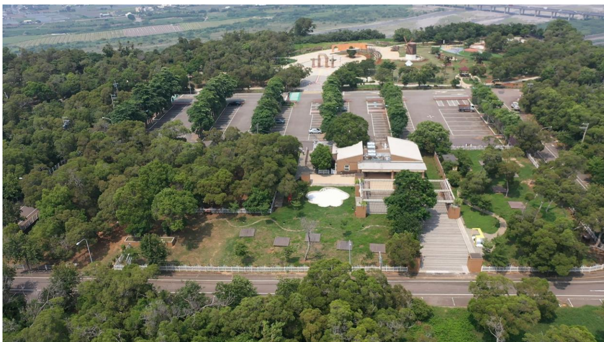
圖3.1-3 基地範圍空拍圖