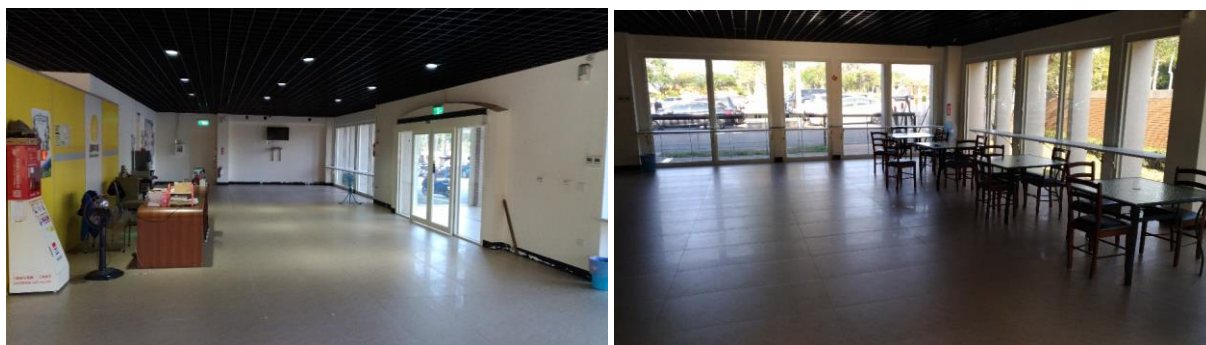
圖3.1-4 遊客中心現況圖